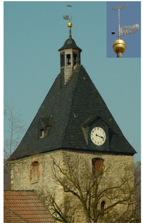
Südturm 26 m hoch mit Walmdach