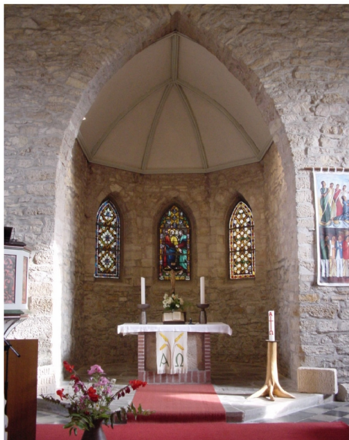
Eingezogener Chor mit Triumphbogen