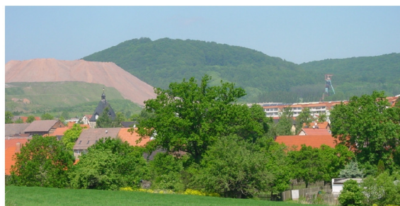
Ortsansicht von Südosten

Kirchenbeschreibung nach "Dehio 1998" : Ev. Pfarrkirche St. Petri. Neugotische Saalkirche aus Werksteinen, in Nord-Süd-Ausrichtung mit eingezogenem Chor mit 5/8-Schluß im Norden, 1876/77 erbaut. Der ehemalige Chorturm des Vorgängerbaues, vermutlich um 1442 errichtet, schließt im Südwesten an das Langhaus an, ist erhöht und mit einem Walmdach mit Dachreiter versehen. Im Inneren offener Dachstuhl.