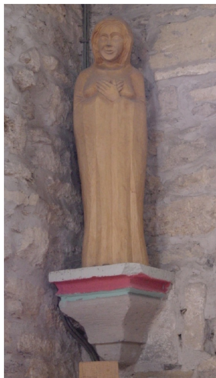
Frauenfigur rechts neben dem Chor