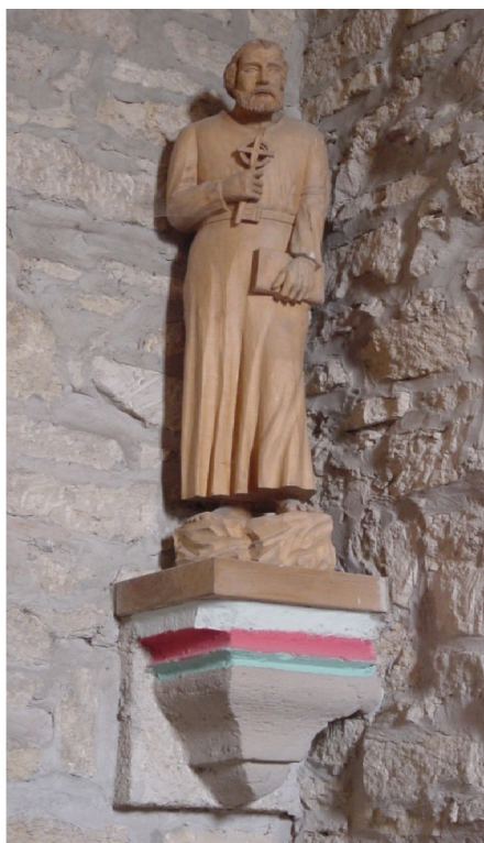
Petrus, Figur links neben dem Chor