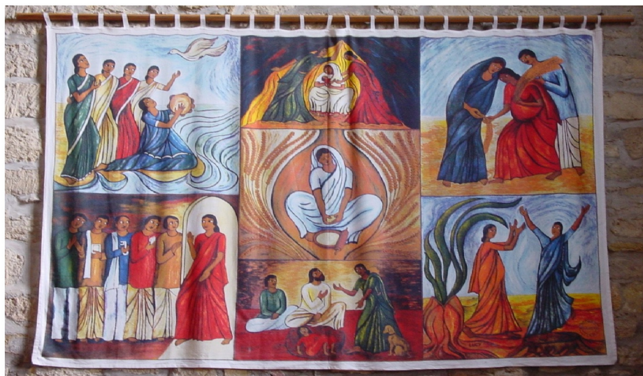
Wandläufer rechts neben dem Chor, aktuelles Hungertuch