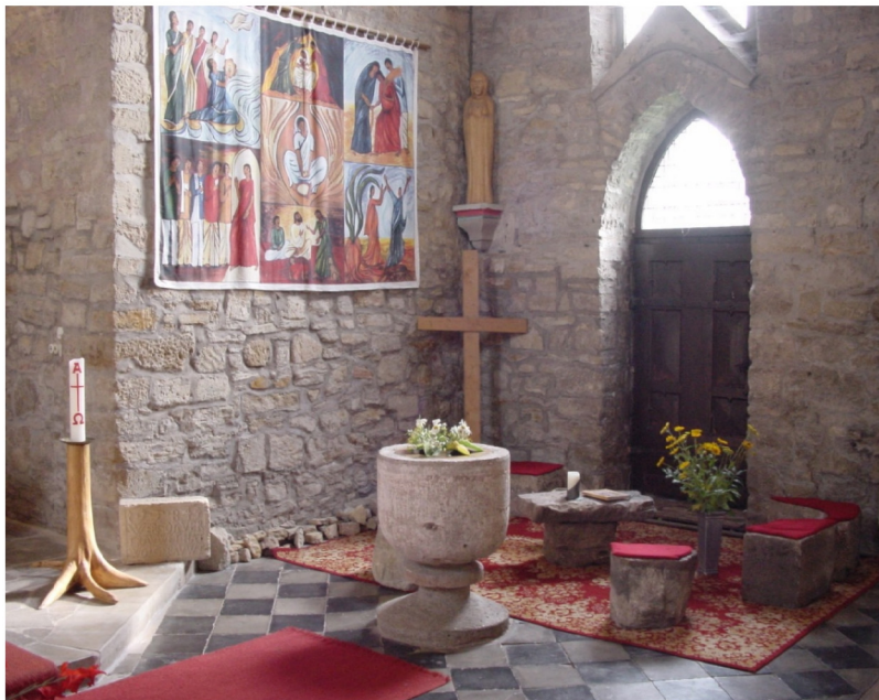
Bereich rechts neben dem Chor