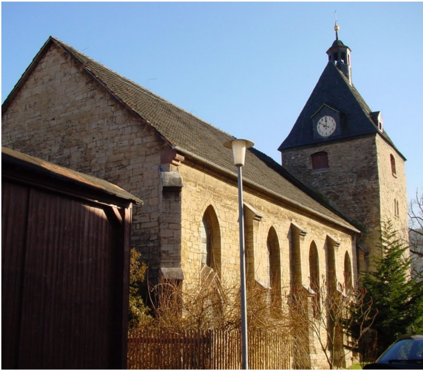
Kirchenansicht von Nordwesten