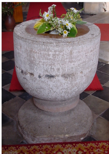
Alter pokalförmiger Taufstein