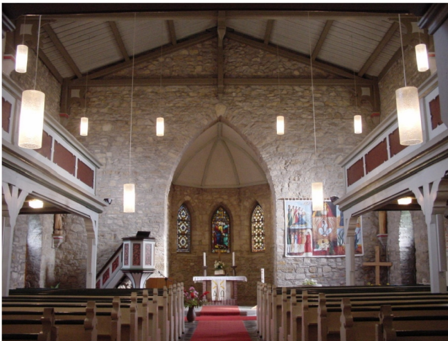
Innenansicht Richtung Chor