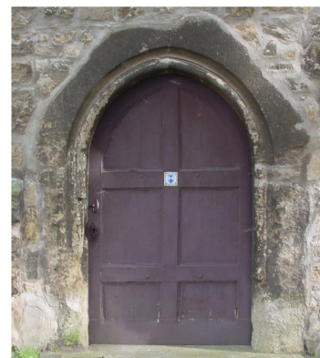
Eingang durch den Südturm