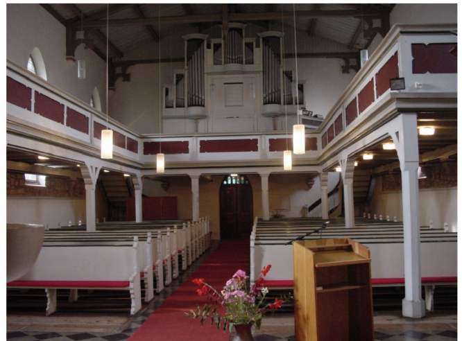
Innenansicht Richtung Kirchenschiff

Kirchenbeschreibung nach "Dehio 1998" : Ev. Pfarrkirche St. Petri. Neugotische Saalkirche aus Werksteinen, in Nord-Süd-Ausrichtung mit eingezogenem Chor mit 5/8-Schluß im Norden, 1876/77 erbaut. Der ehemalige Chorturm des Vorgängerbaues, vermutlich um 1442 errichtet, schließt im Südwesten an das Langhaus an, ist erhöht und mit einem Walmdach mit Dachreiter versehen. Im Inneren offener Dachstuhl.