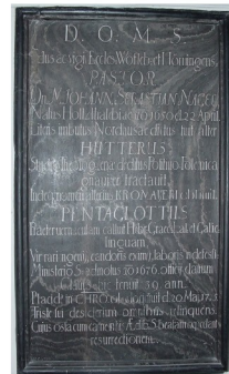
Grabtafel von 1715