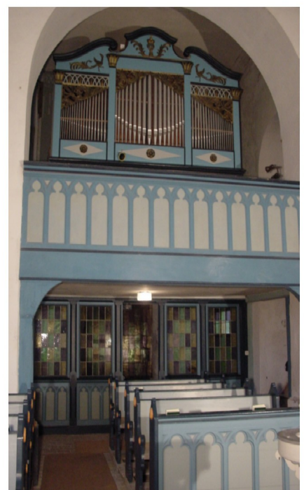
Innenansicht Richtung Orgel