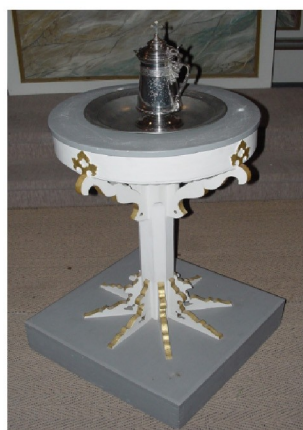
Taufbecken und -kanne

Turm: Länge 6,5 m, Breite 7 m, Höhe 25 m Turmhöhe / Kirchenlänge = 1,47