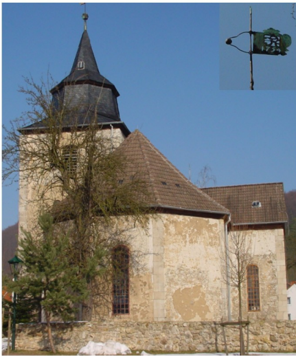
Kirchenansicht von Süden