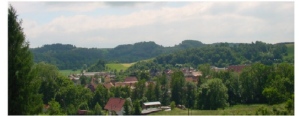
Ortsansicht von Nordosten