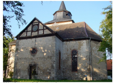
Kirchenansicht von Osten