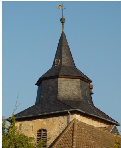
Westturm 25 m hoch