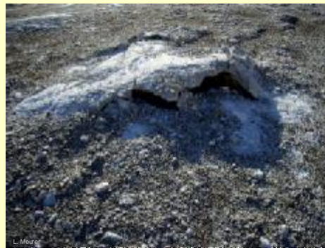
Anhydrit und Wasser lassen Neues entstehen - es bildet sich Gips!

Alle Gesteine des Zechsteins waren und sind von großem wirtschaftlichen Interesse. Der Kupferschiefer wurde seit der Bronzezeit zur Erzgewinnung genutzt, der Dolomit fand als Werkstein Verwendung zur Errichtung von massivem Mauerwerk, z. B. auch der Stadtmauer von Nordhausen. Die große Mächtigkeit und vielfältige Ausbildung der Anhydrit- und Gipslager machten diese seit dem Mittelalter zu einem begehrten Rohstoff. Gips als Mörtel finden wir schon in den Wehrbauten des Mittelalters, Gips als Werkstein wurde u. a. zum Bau von Kirchen, wie z. B. in Petersdorf und Stempeda genutzt, Gips als Werkstein für künstlerische Arbeiten wurde unter der Bezeichnung Alabaster bis in das 20. Jahrhundert für zahlreiche z. T. künstlerisch hochwertige Arbeiten verarbeitet. Anhydrit als Rohstoff für die Produktion von Schwefelsäure wurde bis 1990 gewonnen und heute spielen Gips und Anhydrit immer noch eine herausragende Rolle als Rohstoff vor allem der Baustoffindustrie.